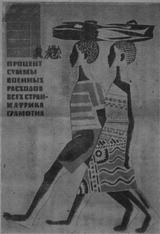
Планат художника В. Каранашева (издательство «Советский художник»).

технические и научные кадры, всячески поощряется развитие государственного сектора. Большую помощь в завоевании политической и экономической самостоятельности народам Африки оказывают Советский Союз и страны социалистического лагеря. Экономическая помощь социалистических стран основывается на политике дружбы и равноправного сотрудничества и предоставляется на те цели и в такой форме, которые лучше всего отвечают национальным интересам суверенных африканских государств. Голос свободных стран Африки все громче и увереннее звучит на мировой арене.