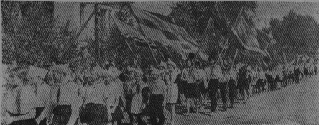
На снимке: идут колонны юных ленинцев...