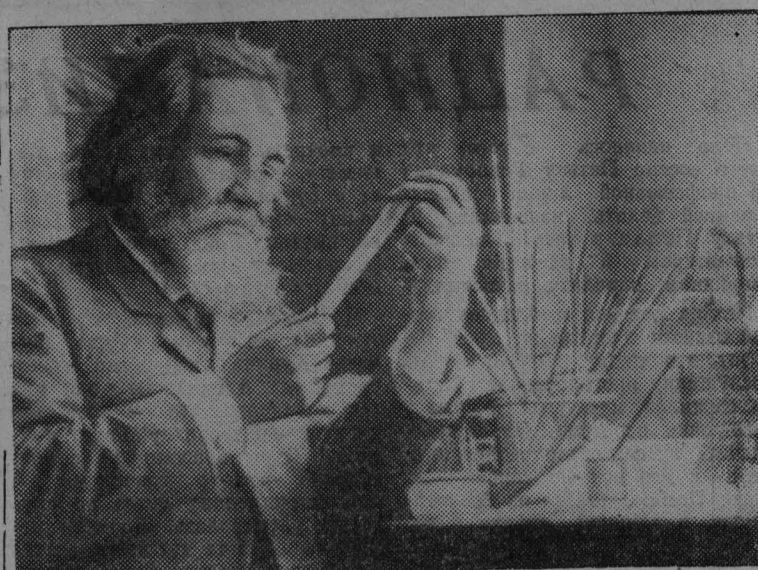
МЕЧНИКОВ Илья Ильич (1845—1916), великий русский биолог, один из основателей современной экспериментальной медицины.

Сегодня 120 лет со дня рождения Мечникова И. И.