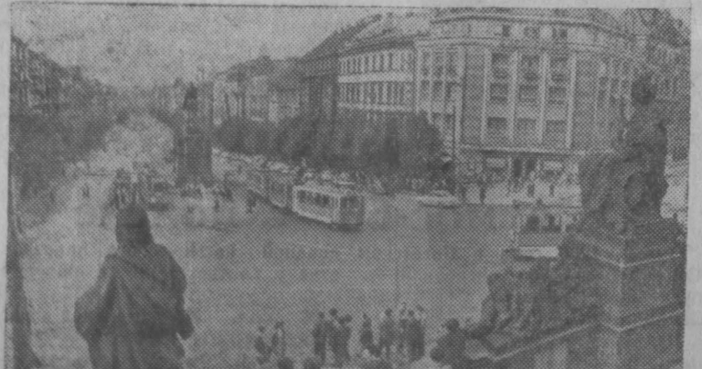
Прага. Вацлавская площадь.

9 мая исполнилось 20 лет со дня освобождения Чехословакии от фашистских захватчиков.