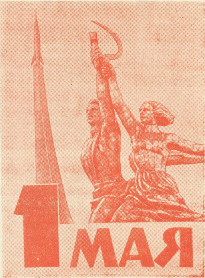
Фотоплакат Е. Кассина и В. Мусаэльяна. Фотохроника ТАСС.

Сейчас во всех отделениях хлеборобы приступили к выборочному боронованию зяби и подкармливанию минеральными удобрениями озимых. Думаем, что в этом году труженики нашего хозяйства успешно справятся со взятыми обязательствами. А. ШВЕЦОВ.