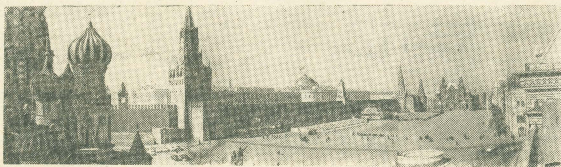
МОСКВА. Красная площадь.