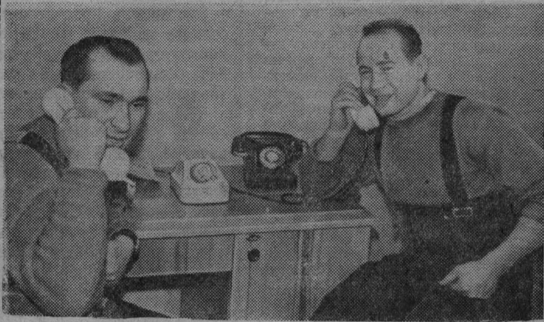
Космонавты Павел Иванович Беляев и Алексей Архипович Леонов после приземления.