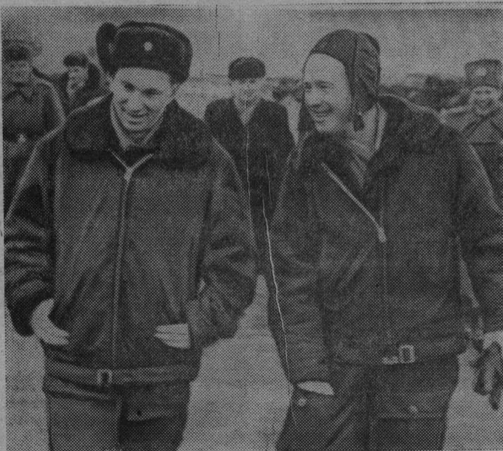
Космонавты Павел Иванович Беляев и Алексей Архипович Леонов после приземления.