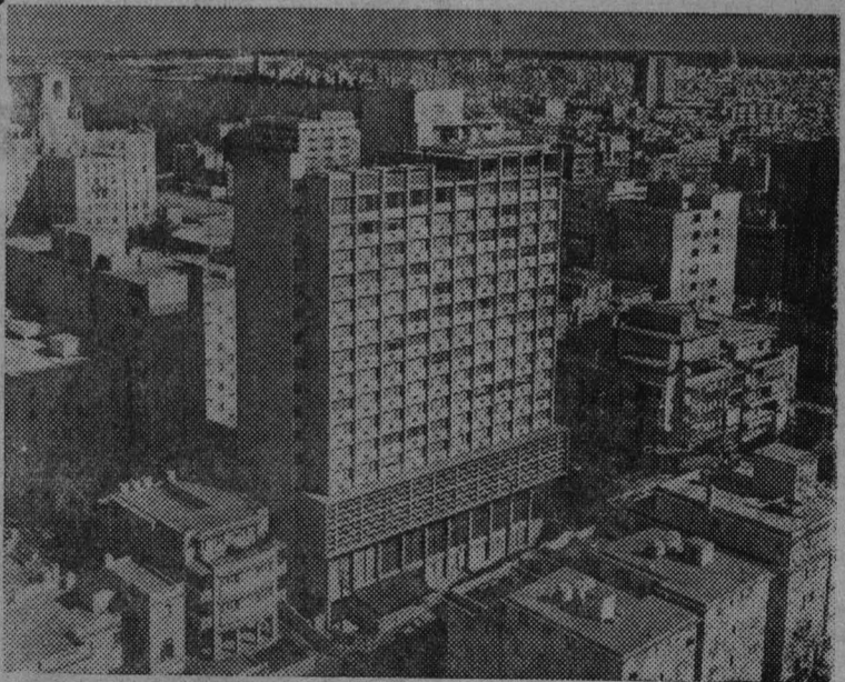
Столица Республики Куба—Гавана.