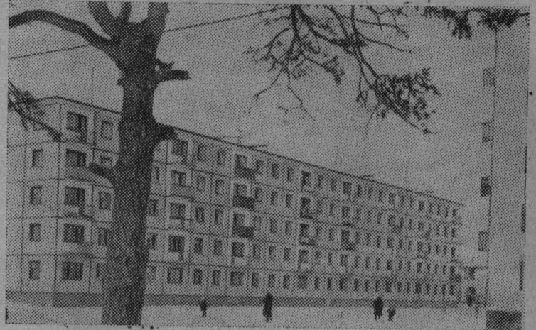
На снимке: два года назад этой улицы еще не было в городе, а сейчас на Восточной улице десять 80-квартирных домов.