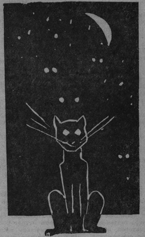
Рис. В. Камышева. пос. Ижморский.

—Когда не соблюдают прави- ла космического движения.