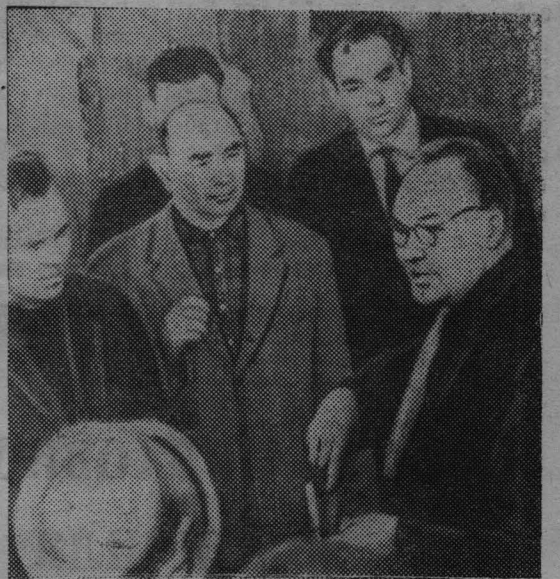
Известный советский скульптор, народный художник СССР Николай Васильевич Томский (справа) во время встречи с преподавателями и студентами Московского авиационного института.

19 декабря исполнилось 65 лет со дня рождения Н. В. Томского.