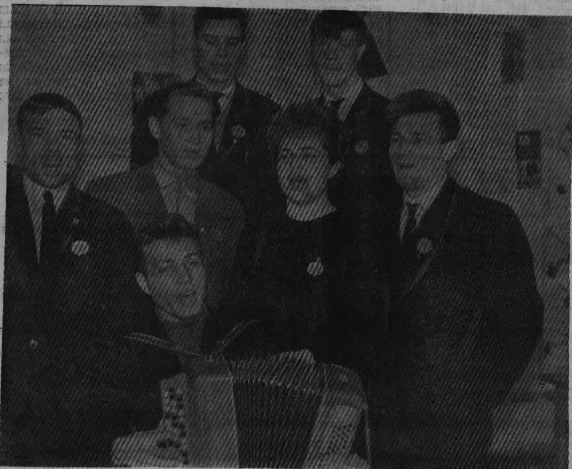
А в перерыве — веселые песни, задорные пляски, шутки.