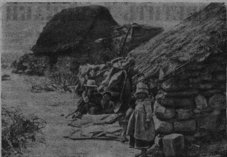
Перу. Безысходна жизнь этих детей. Высоко в горах в полуразвалившихся лачугах влчат индейцы полунисенское существование.