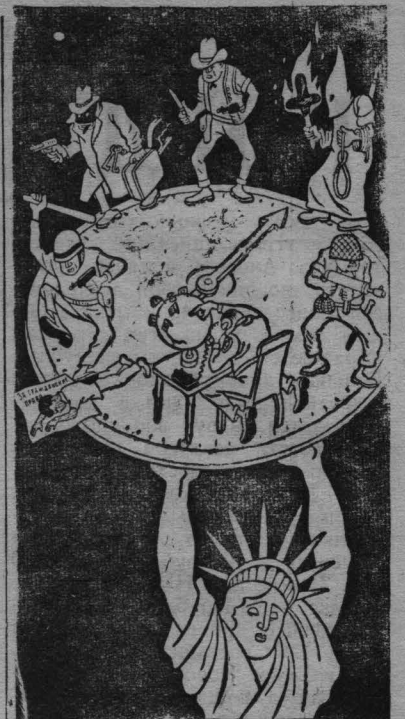
(По американской статистике в США каждые 10 минут совершается преступление)

Преступные типы у них многолики. Не только в блатной, но и в правящей клике: