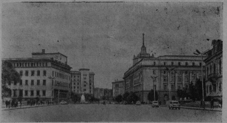
Болгария. Город София.

9 СЕНТЯБРЯ — НАЦИОНАЛЬНЫЙ ПРАЗДНИК БОЛГАРСКОГО НАРОДА — ДЕНЬ СВОБОДЫ