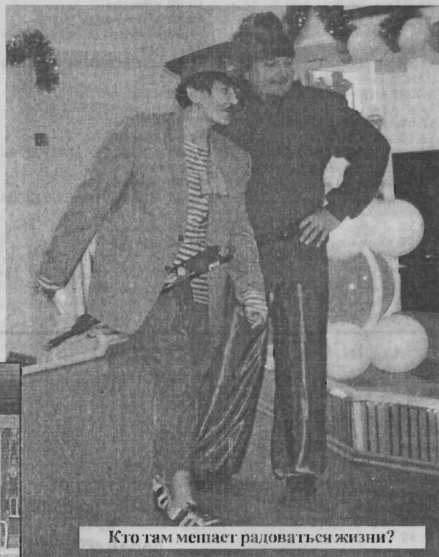
Кто там мешает радоваться жизни?