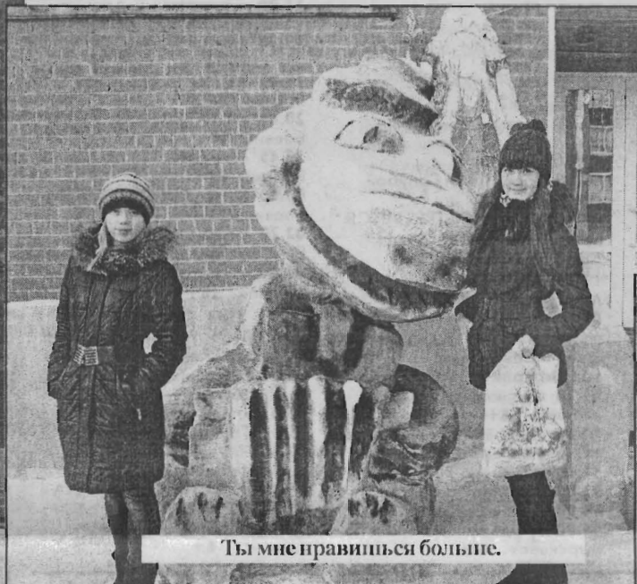
Ты мне нравишься больше.