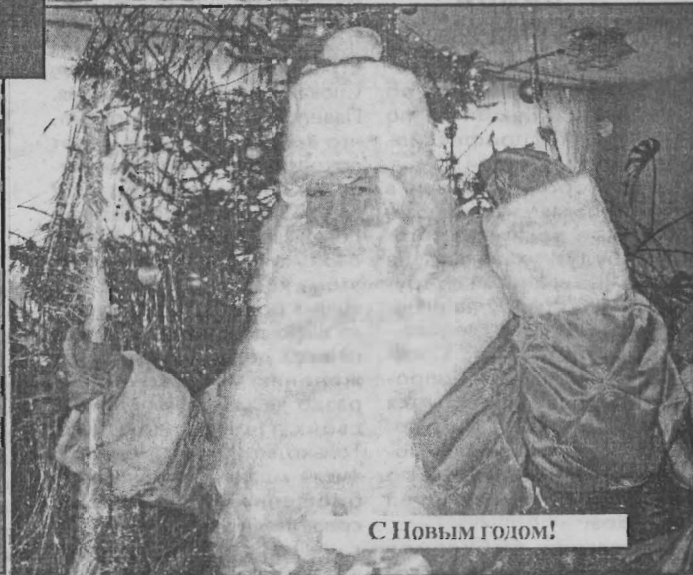
С Новым годом!