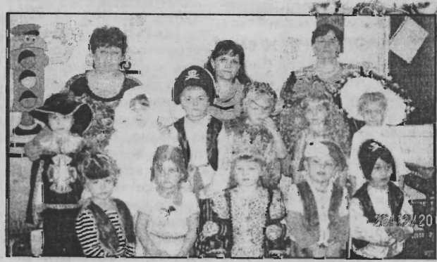
Средняя группа Новоиколаевского детского сада поздравляет своих родителей с Новым годом! Счастья, здоровья, успехов вам!!

Иностранцы снова могут усыновлять кузбасских ребятшек В конце декабря областной парламент вернул право иностранцам усыновлять детей в регионе, который местные парламентарии признали утратившим силу областной закон, запрещающий гражданам из-за рубежа и лицам без гражданства усыновлять кузбасских детей-сирот, сообщает Vse42.ru. Закон был признан утратившим силу в связи с протестом прокурора Кемеровской области. Напомним, что прокуратура опротестовала закон, запрещающий иностранцам усыновлять детей в регионе, который местные парламентарии признали в сентябре 2013 года. Запрет был снят. В ноябре 2013 кузбасские парламентарии обратились в Госдуму РФ с предложением принять закон, запрещающий всем иностранцам усыновлять детей из России.