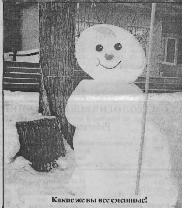
Какие же вы все смешные!