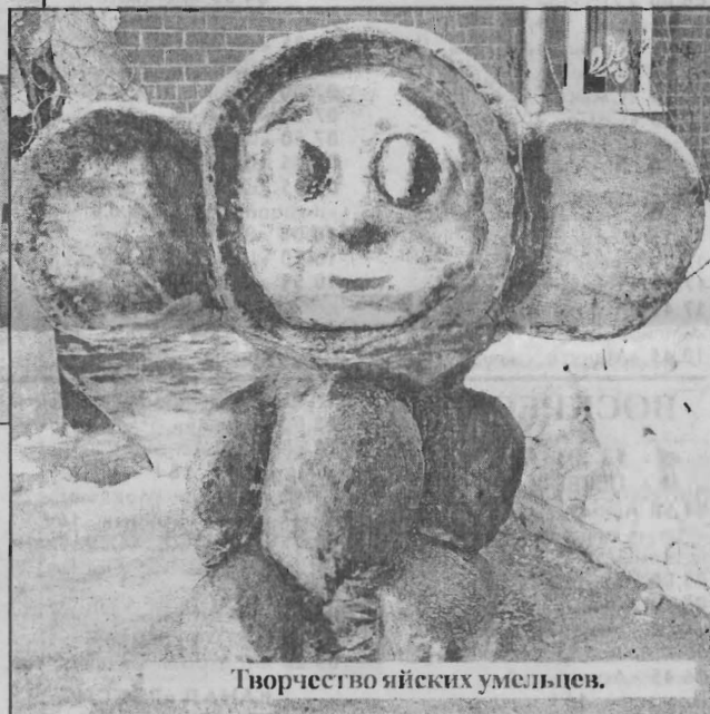
Творчество яйских умельцев.