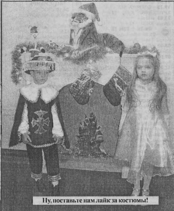
Ну, поставьте нам лайк за костюмы!