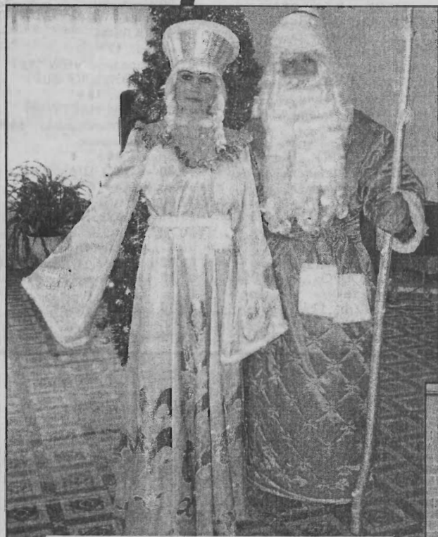
Дед Мороз и Снегурочка.

Весёлый праздник Новый год! Его приближение ощущается задолго: с появлением забавных снежных фигурок, яркой иллюминации, разноцветных гирлянд и украшенных ёлок; с детьми, спешащими на костюмированные балы для встречи с Дедом Морозом и Снегурочкой за своими новогодними подарками и призами; с непрерывным подведением итогов, корпоративными вечерами и планами на будущее; с торговыми прилавками, ломаящимися от различных заморских фруктов, шоколадных конфет и вкусных деликатесов; с традиционной бессонной ночью с шампанским, салатом «Оливье» и телевизионным «Голубым огоньком». И вот он приходит. Тихо. Незаметно. И только бой курантов и дружное «Ура!» возвещают о том, что уже начался отсчет последних секунд до наступления Нового года! Здравствуй, Новый 2014 год! Мы ждали тебя! Мы рады тебе!