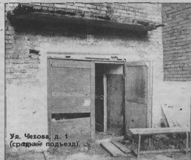
Ул. Чехова, д. 1 (средний подъезд)