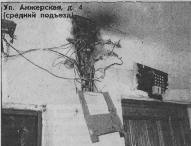
Ул. Анжерская, д. 4 (средний подъезд)

Средний подъезд четырёхэтажного дома по ул. Анжерская, 4. Слово его жильцам.