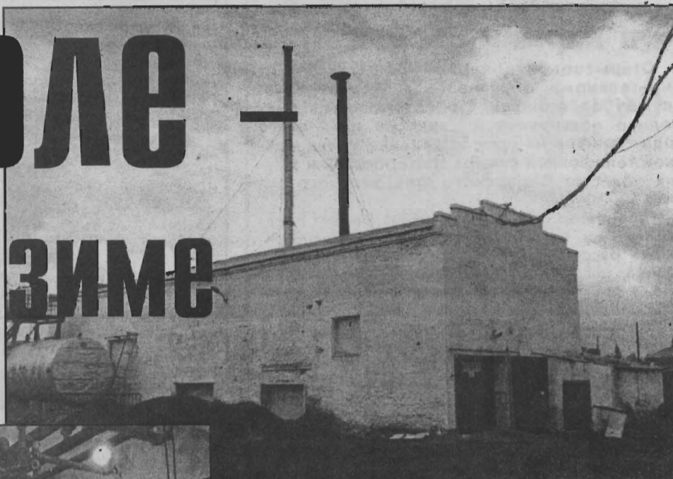
Центральная котельная р. п. Яя

замену теплотрасс пока нет: будем латать старые. В котельной больницы 2 котла обмурованы. Думаю, что ещё два дополнительно установим к сентябрю. Есть проблемы здесь по насосной группе, но мы её заказали и нам её поставят. Есть серьёзные споры по поводу нашей причастности к котельной п. Красная Горка, где ещё не решены до конца проблемы согласования, передачи объекта. Аналогичная ситуация с агрофирмой «Кайгат», через территорию которой идёт водовод. Здесь тоже могут возникнуть проблемы, для решения которых вполне реально и судебное вмешательство. Вопрос о выделении этого участка водопровода коммунальному хозяйству необходимо решать с помощью архитектурного отдела администрации района. Приступаем к строительной части котельной карьера. Подбираем котлы соответствующей мощности, изучаем информацию и предложения по приобретению котлов в Томске, Барнауле, Новосибирске. Поставщики могут гарантировать хранение проплаченных материалов и оборудования на складах только в течение