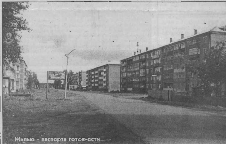
Жильё - паспорта готовности

Р. С. Областные СМИ сообщили о том, что к августу в Яйском районе к зиме готовы лишь 10 из 318 домов с центральным отоплением (3%). Комментарии, как говорят, излишни.