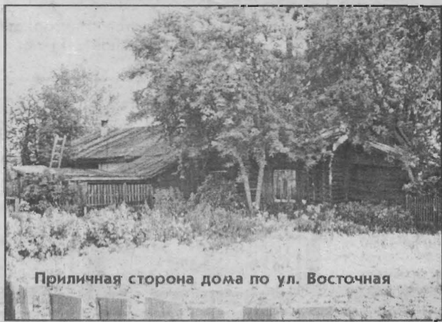
Приличная сторона дома по ул. Восточная

ность здесь ещё вот в чём. Три-четыре квартиры в Яе «ходят из рук в руки» на яйском рынке жилья. Их постоянно перепродают, и цена на них поднимается всё выше и выше. Трёхкомнатная квартира в Яе предлагается покупателям за 750