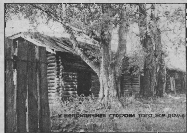
и неприличная сторона того же дома

Отчёт с «Прямой линией» вели журналисты Игорь АЛЕХИН, Сергей МОСИН, Юлия ВОЛКОВА (фото).