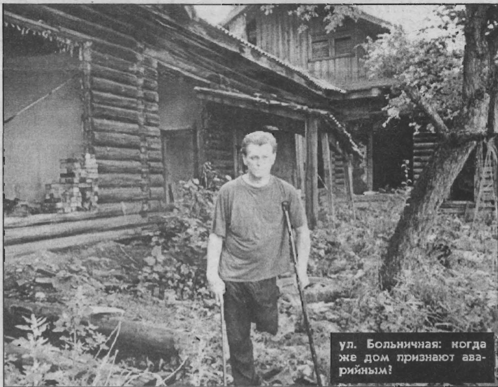
ул. Больничная: когда же дом признают аварийным?

Корр.: - На этом, пожалуй, мы и завершим сегодняшний разговор на «Прямой линии» с читателями газеты «Наше время». Но это не значит, что обсуждение темы окончено. Оно только началось. Тема сноса ветхого жилья, предоставления коммунальных услуг населению в Яйском районе слишком остра и злободневна. Мы ещё не раз к ней вернёмся и приглашаем к заинтересованному разговору наших читателей. Пишите, звоните, заходите! На этой ноте и расстанемся сегодня.