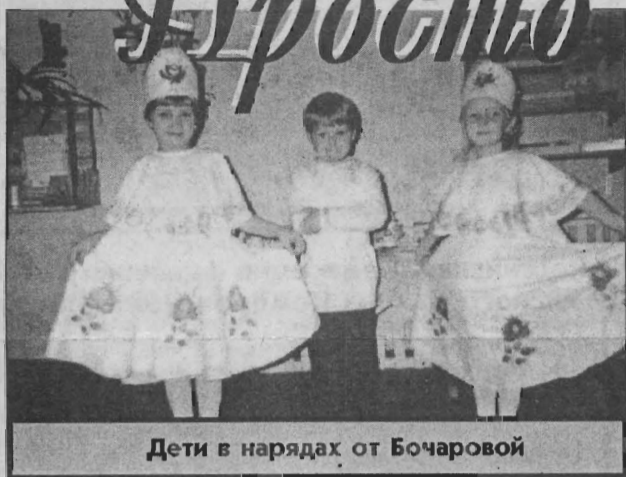
Дети в нарядах от Бочаровой