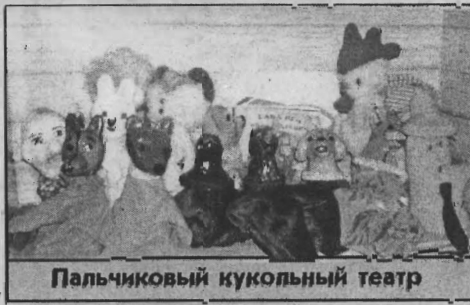
Пальчиковый кукольный театр