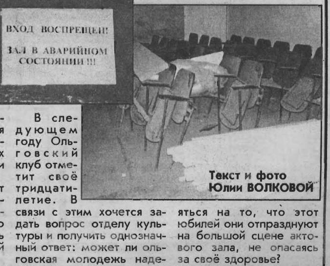
ВХОД ВОСПРЕЩЕНО! ЗАЛ В АВАРИЙНОМ СОСТОЯНИИ!!!

Здесь уже девять лет не показывают кинофильмы. Для этого нет ни киноустановки, ни большого экрана. А как бы хотелось жителям прийти с семьей на вечерний киносеанс!