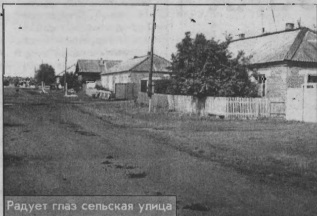
Радует глаз сельская улица

дей. Тех, кто может совершить преступление, у нас на селе можно по пальцам пересчитать. И милиция хорошо работает.