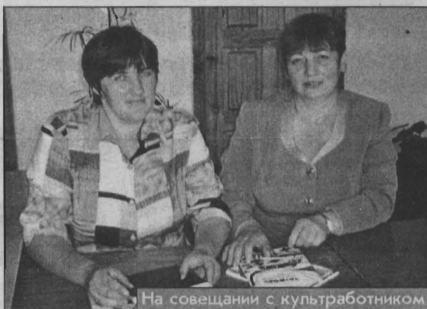
На совещании с культработником