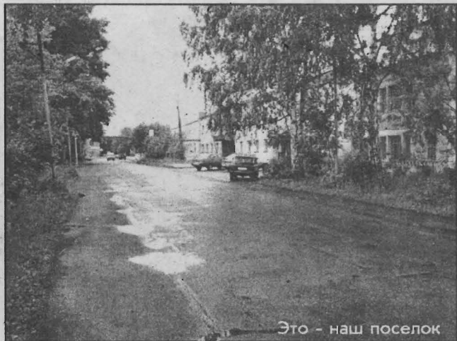
Это - наш поселок

Отношение к религии. Крещеный, православный. С уважением отношусь к другим религиям.