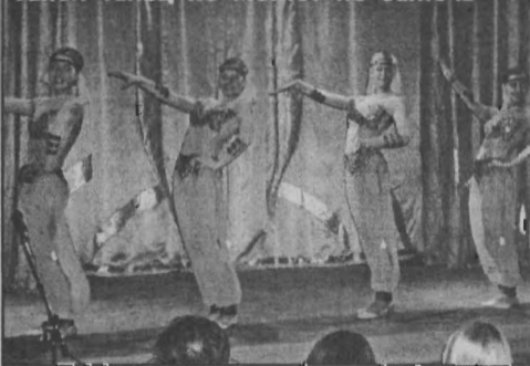
Такой танец не может не зажечь