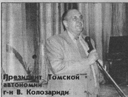
Президент Томской автономии г-н В. Колозариди.