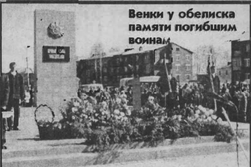
Венки у обелиска памяти погибшим воинам

В тот день было два повода для того, чтобы такое большое количество людей вышло на площадь района – торжественный митинг в честь 60-летия Победы в Великой Оте-