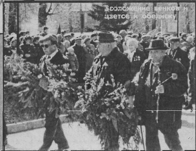
Возложение венков и цветов к обелиску