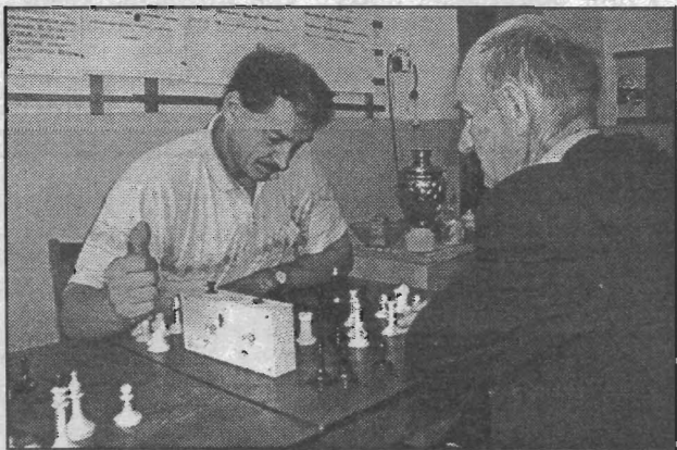
Фото и текст Сергея МОСИНА.

Ещё долго не утихали воспоминания о шахматном турнире, прошедшем в День физкультурника. Он завершился победой В. Цыганкова, вторым был Н. Тищенко, третьим - И. Михеев.