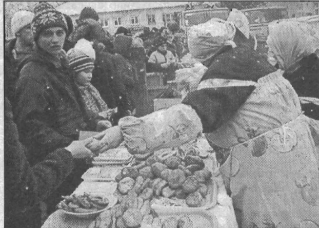
Текст и фото Елены БАБКИНОЙ.