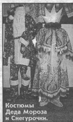
Костюмы Деда Мороза и Снегурочки.

Рассматривая такую красоту, забываешь, что всё это сделали ребята коррекционной школы. Труд помогает им развивать воображение, мышление, приобретать навыки. Преподаватели отмечают, что неугомонные дети, порой, увлекаются своей работой так, что часами с интересом трудятся. На такой выставке ребята внимательно всё рассматривают, оценивают друг друга. И нет для них лучшей оценки, чем признание и одобрение их старания, усердия со стороны взрослых и детей.