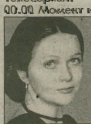
01.05 Наталья Гундарева в фильме "Вас ожидает гражданка Никанорова".