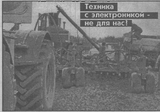
Техника с электроникой - не для нас!

технологичной машиной и не смогли использовать её по назначению. Два года она простояла в гараже, как музейный экспонат достижений высокого разума. Ру-