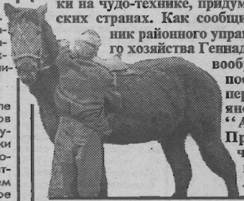
Такая "техника" надёжней!