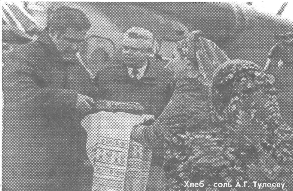
Хлеб - соль А.Г. Тулееву.