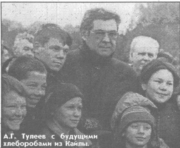
А.Г. Тулеев с будущими хлеборобами из Кайлы.

Визит губернатора был скоротечным, так как его ждали ещё в двух хозяйствах Ижморского района. Обсудив ряд важных вопросов с руководителями района, поблагодарив работников культуры за хорошее исполнение песни, сфотографировавшись на память, он поспешил к вертолету. Несмотря на занятость, Аман Тулеев заметил ватагу местных ребятишек, прибежавших посмотреть на "винтокрылую птицу". Он подошел к ним, с каждым поздоровался, поинтересовался о жизни. Гордостью засияли глаза детей. Это рукопожатие губернатора запомнится им надолго. И, может быть, через десяток лет с такой же гордостью они будут получать губернаторские премии за успешную работу в поле.