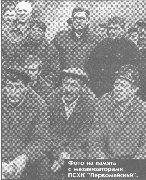
Фото на память с механизаторами ПСХК "Первомайский".