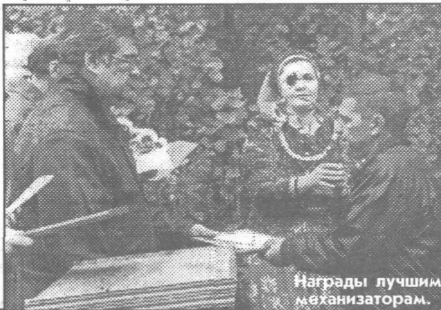
Награды лучшим механизаторам.