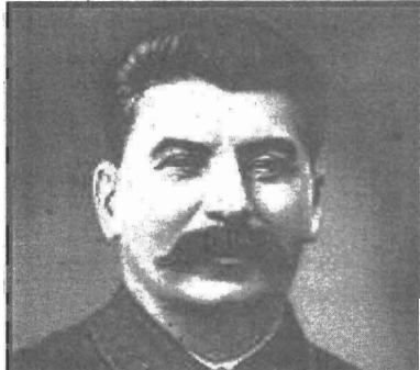
60 ЛЕТ БИТВЫ ПОД МОСКВОЙ