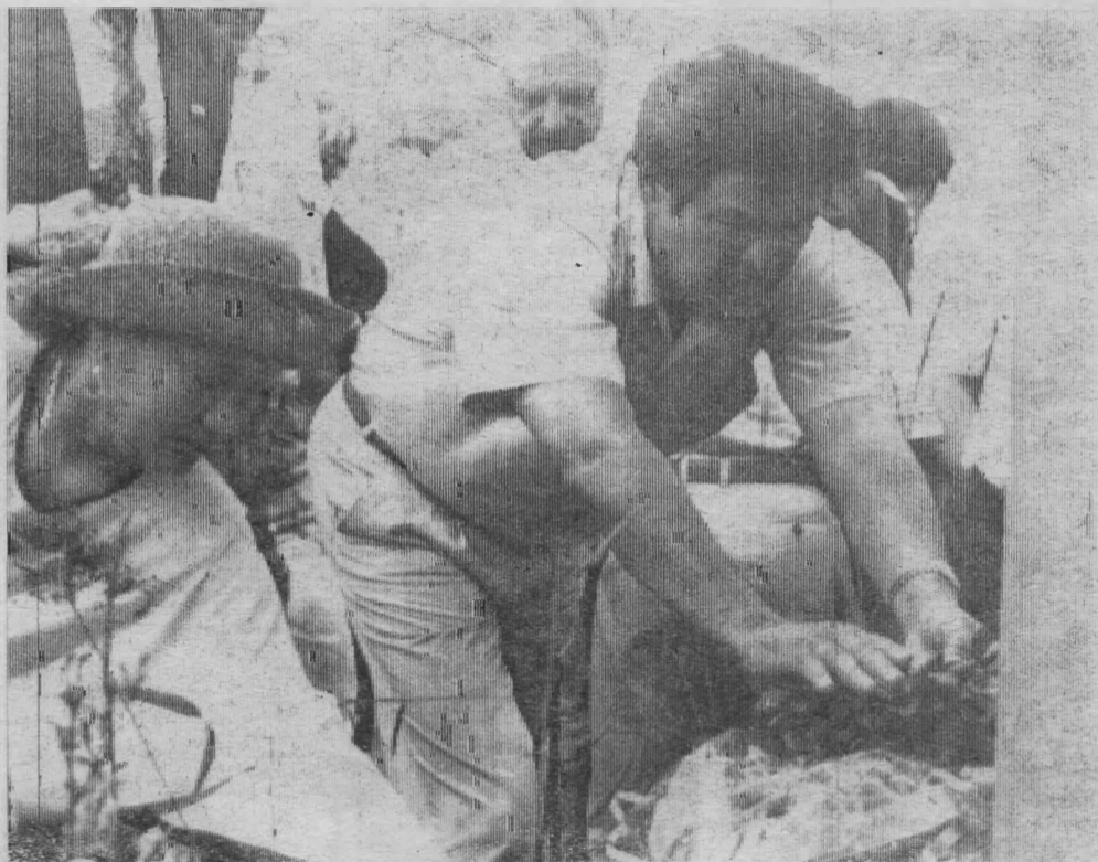
В субботу в Марьевке состоялись Федоровские чтения. Репортаж о них — на 2-й странице. На снимке: Аман Тулеев возлагает цветы к памятнику поэта.

При пересчете: КРС в округе ранее судимого охотника КСХП «Яйское» 20 июля была выявлена недостача пяти голов. Ущерб хозяйству составил 7 миллионов рублей.