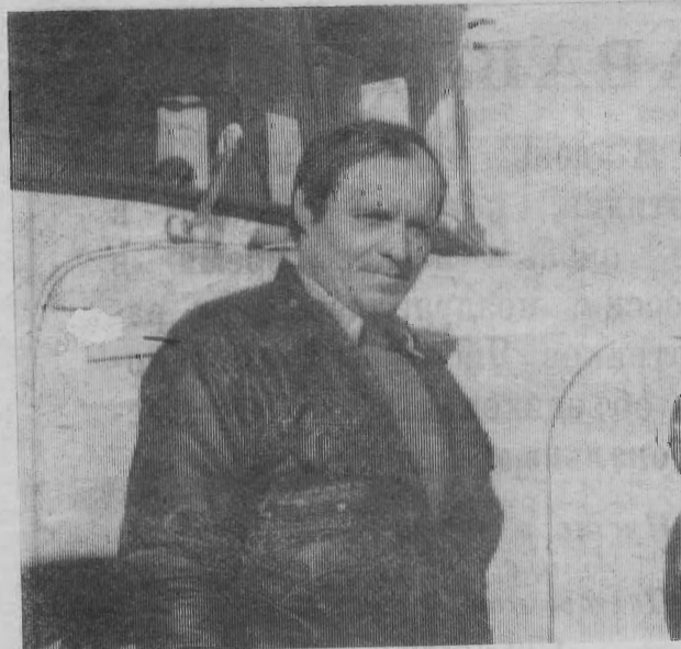
Без добросовестной, оперативной работы автогаража районной больницы трудно представить нормальную работу всего РТМО. А водители здесь, в основном, опыт-

поликлинике и перевести в нее кабинеты из помещений старой больницы. Место для этого есть, есть возможность подключиться к водопроводным и тепловым сетям, но опять все упирается в отсутствие денег. Хотя нужно их не так уж и много — столько, сколько сегодня стоит двухквартирный жилой дом. Медики живут надеждами, что все же вопрос о строительстве пристройки решится в скором времени.