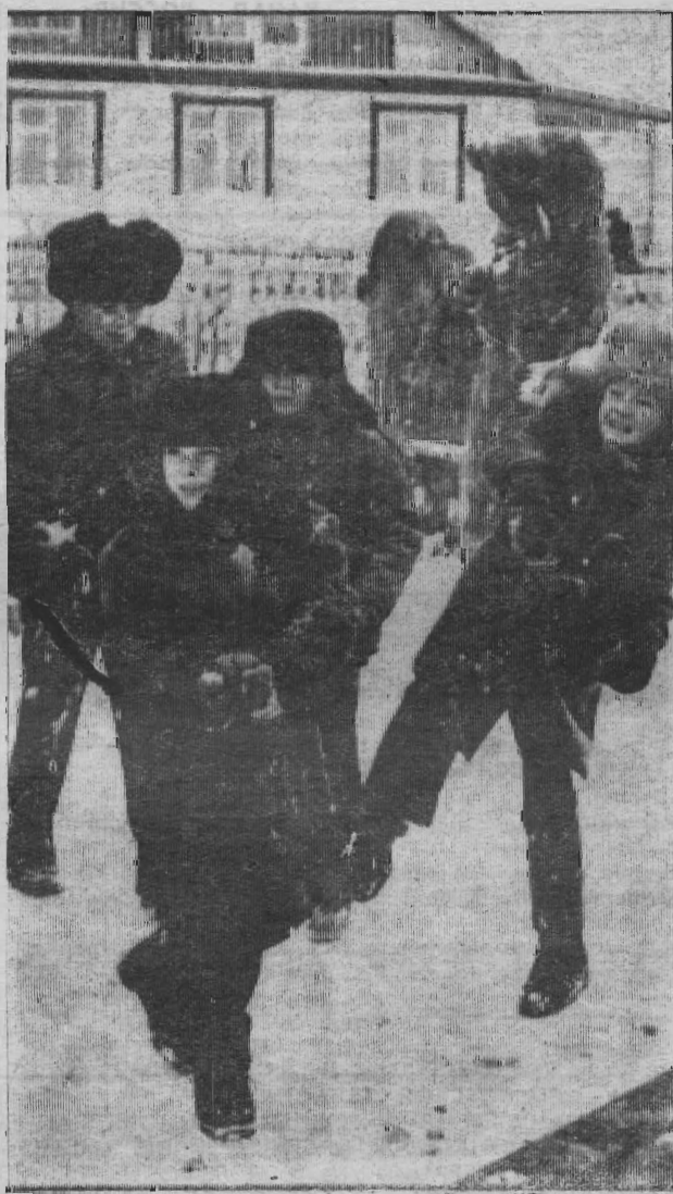
На Рождественских каникулах.