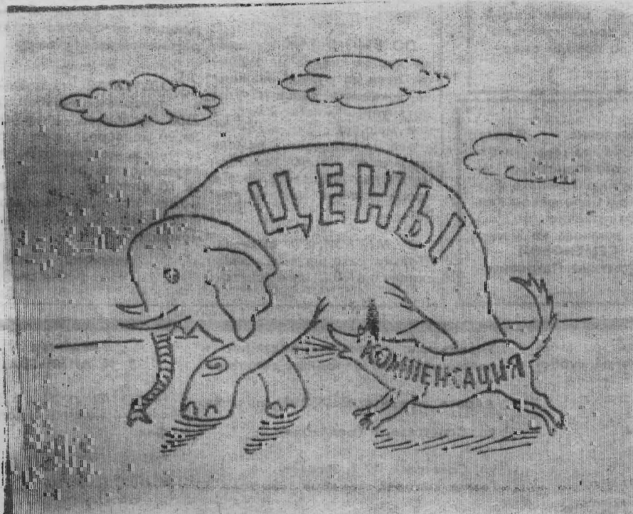
Рисунок В. Жабского

ОТ РЕДАКЦИИ. Уважаемый Илья Александрович! Как мы будем дальше жить, инвалиды, не знает сегодня никто. Так называемая либерализация только еще начнется, а мы уже начинаем чувствовать ее вредность на собственной шкуре. Авторитарные экономисты-эксперты рассчитали, сколько нужно зарабатывать бедному человеку в январе. Прожиточный минимум для него должен составить 14150 рублей. 8200 рублей должен иметь в месяц человек среднего достатка. А чтобы жить нормально полноценной и сытой жизнью, в январе вы должны иметь доход на одного человека в 26000 рублей. Эти же эксперты прогнозируют в «Аргументах и фактах», что в апреле цены увеличатся еще в 10 раз, значит, и доход для населения должен быть тоже больше в десять раз. Эти сухие цифры статистики для нас больше похожи на сказку. А в жизни... не приходится надеяться на лучшее.