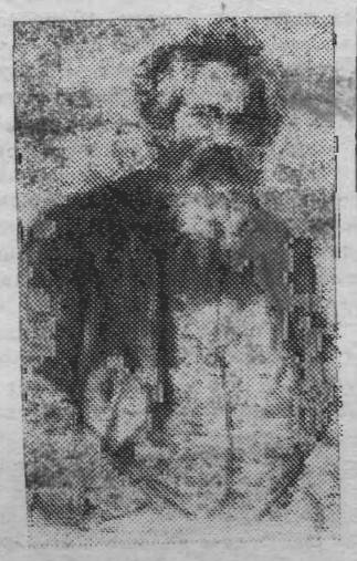
На снимке: Иван Иванович Шишкин. Портрет работы И. И. Крамского.

Имя Ивана Ивановича Шишкина — величайшего мастера русского национального пейзажа — широко известно. Многочисленные копии с его картин мы встречаем повсюду: в гостиницах, привокзальных залах ожидания, столовых; имя Шишкина отождествляется с воспроизведением на конфетных обертках с картин «Утро в сосновом бору». К сожалению, такая массовая популяризация картин И. И. Шишкина привела к поверхностному пониманию творчества этого замечательного художника, о котором В. И. Немирович-Данченко писал: «Поэт природы. Поэт, думающий его образами, разбирающий простую смертную трагедию равнодушно».