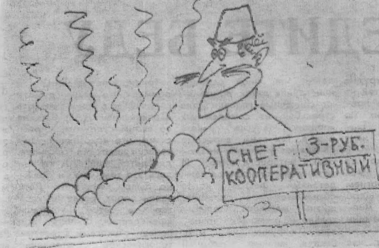
Рисунок В. Жабского

Рост цен, конечно, можно было ожидать, но не такой же большой скачок. Ведь у нас они подскочили: в 10 и больше раз, конечно, нам, деревенским, легче прожить, чем городским. В Москве прожиточный минимум — 2000 рублей. У нас животнободны сейчас зарабатывают 160—200 рублей. Что это за зарплата, один раз в магазине сходить! Поглядят, пусть лучше работают, больше молока полу-