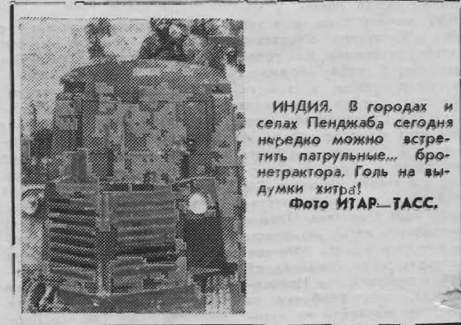
ИНДИЯ. В городах и селах Пенджаба сегодня нередко можно встретить патрульные... бронетрактора. Голь на выдумки хитра!

Пермскому заводу минеральных удобрений трудно стало сбывать продукцию. Из-за подорожания многие хозяйства отказываются от нее, несмотря на то, что это грозит потерей урожайности. Нынче все бедны — и потребители, и производители. Вот и стоят склады, заполненные карбамидами. Единственный выход — продажа на экспорт.