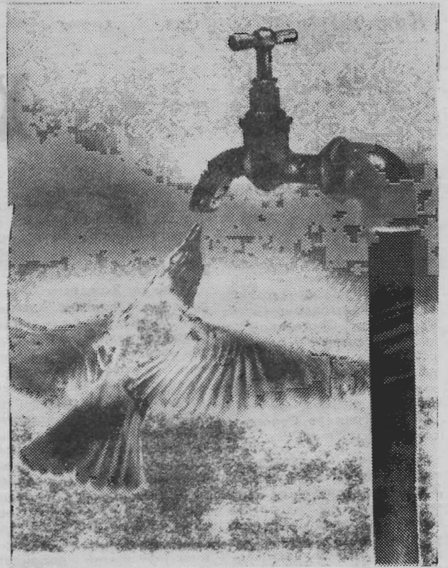
Хочешь жить — умеи вертеться...