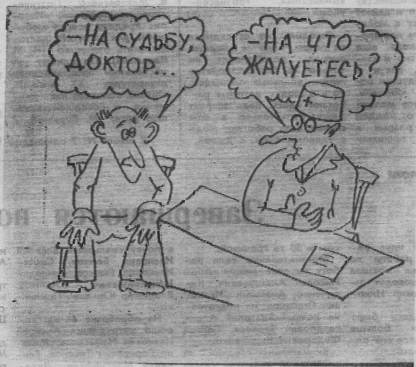
Рисунок В. Жабского.

Внимание! Отдел культуры приглашает всех на праздник детства в субботу с 12 часов дня до 2 часов ночи на стадионе и на центральной площади поселка. Программа праздника остаётся прежней.