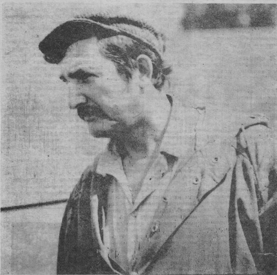
На снимках: на полях колхоза «Бекетский».