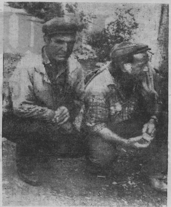
Думай-не думай, а сеять надо...

—Такое ощущение, что между вами протекает река непонимания. Холодом какой-то от вас веет. Вы сегодня не только агропромышленную конференцию хотели «дринать», по-моему, и посеяли в этом году много в душе не воспримайте. Но я не об этом даже хочу сказать. Надеюсь с вами было приятно работать в последние времена. Сегодня все такие восторженные, ершистые. Вы все же люди, и все вы были, есть и будете. Будет хлеб или его не будет, зависит от вас. И как бы вы сегодня или завтра к этому ни подошли, все равно сеять и убирать вам. 6 тысяч тонн сдаете хлеба. Да боятся вы, и Кемеровская область без этих тонн хлеба обидится, и все без вас переживут. Ленько одни вы остаетесь в накладе, если вы не соберете урожай. Сделаете — будете богатыми. Так же по молоку. Не