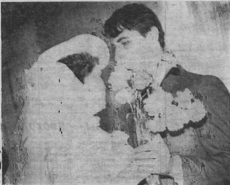
Вроде и мало радостного семьи. В эти весенние дни дами на лучшее, то и все в нынешней жизни, однако количество бракосочетаний заметно увеличилось, а в нашем районе когда молодые сердца насвадьбы, создаются новые полнены любовью и надеж-