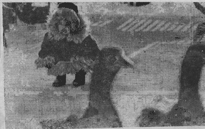
—Гуси, гуси! Га-га-га... (Курганская область).

Любители острых ощущений провели в Сан-Франциско необычное состязание — бег по крыше небоскреба высотой 55 метров. Для «беговой дорожки» был выбран бетонный парапет у края крыши шириной 15 сантиметров и общей длиной 355 метров. Участники должны были пробежать или пройти это расстояние без шестибаллансира. Победителем стал 20-летний радиотехник. Его время — 2 минуты 25 секунд.