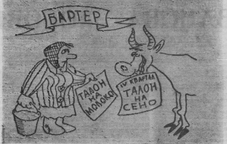
Рисунок Вл. Жабского