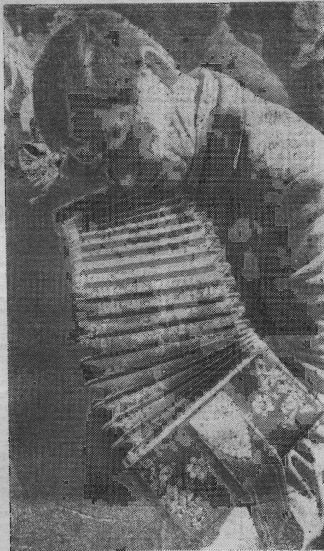
«Веселится» усталый народ