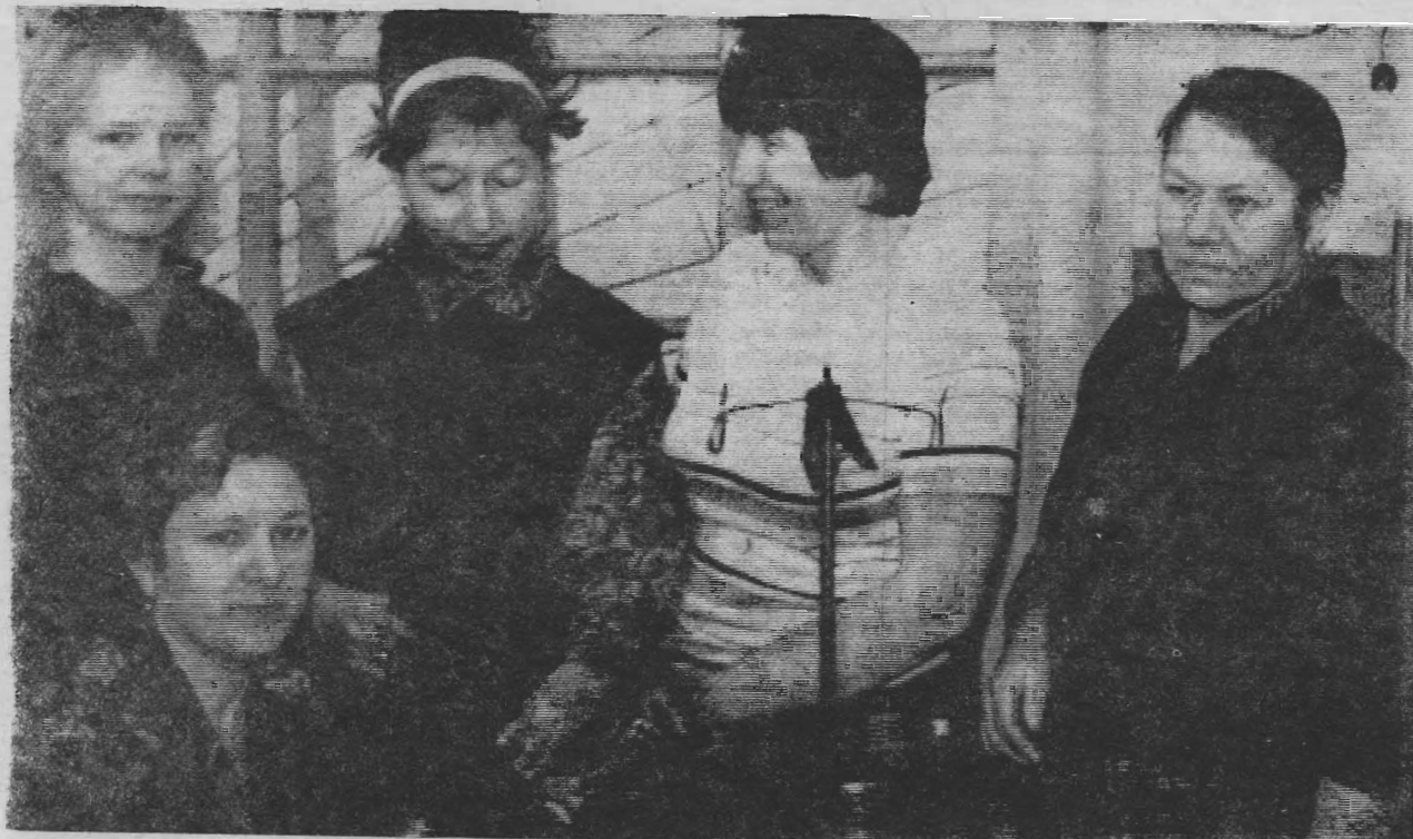
Коллектив цеха № 2 швейной фабрики «Восход» успешно потрудились в этом году. Досрочно выполнен план года. Заслуга в этом успехе цеха № 2 читатели смогут познакомиться на 3 странице нашей газеты.