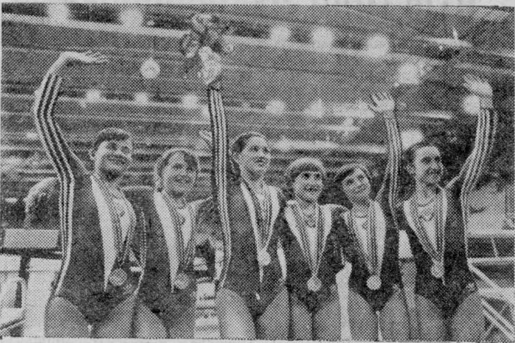
Москва. Дворец спорта в Лужниках. Гимнастика. В командном первенстве олимпийское золото завоевали советские гимнастки.

НА СНИМКЕ: чемпионки Олимпиады-80 в командном первенстве.