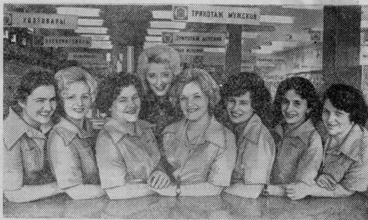
Тулская область. Новое здание торгового центра построено на центральной усадьбе совхоза «Яснополянский».

Нижний этаж занимают магазины промышленных и продовольственных товаров. На втором этаже — ресторан.