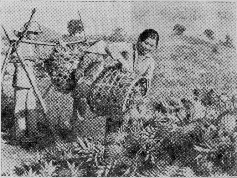
Вьетнам. Более чем в 20 раз увеличились площади ананасовых плантаций во Вьетнаме за последние пять лет. Перерабатывающая промышленность получила десятки тысяч тонн этих пользующихся большим спросом плодов.

НА СНИМКЕ: сбор урожая ананасов в госхозе Дук Фу провинции Куанг-Дананг.