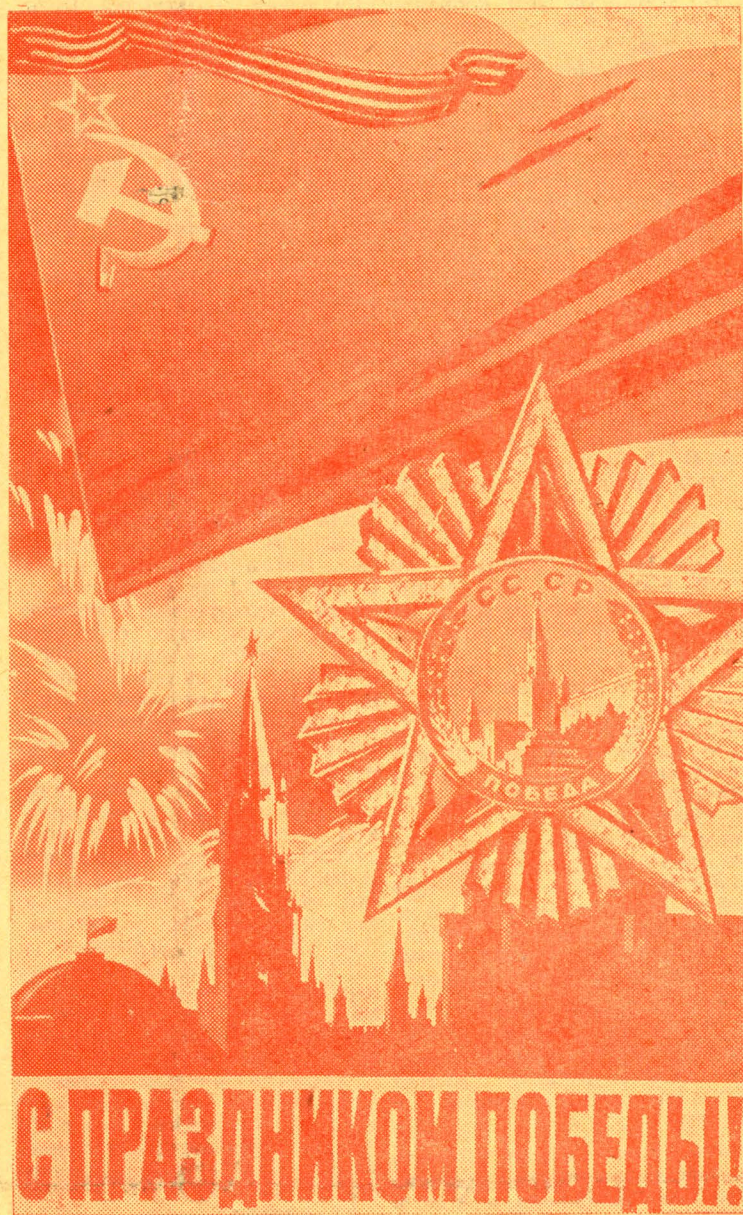
Плакат художника В. Викторова. Издательство «Плакат».