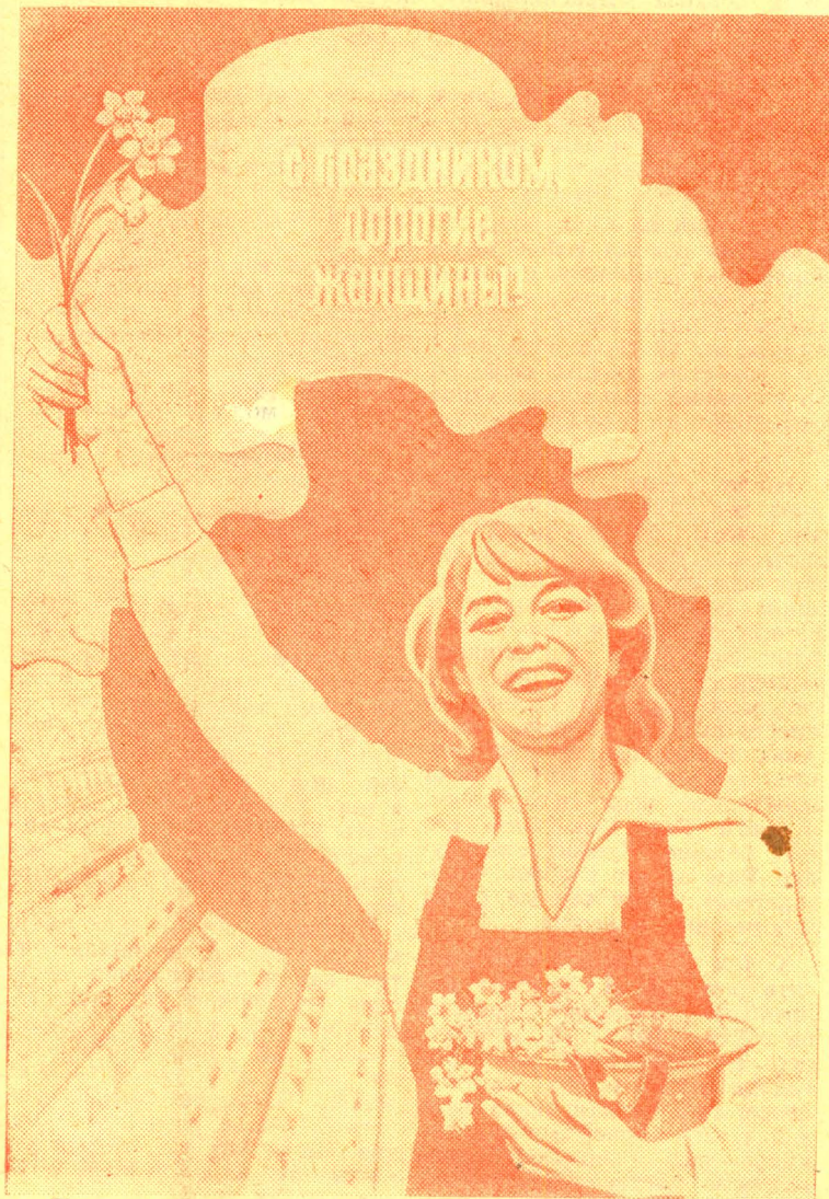
Плакат художника В. Колюхова. Издательство «Плакат». Фотохроника ТАСС.