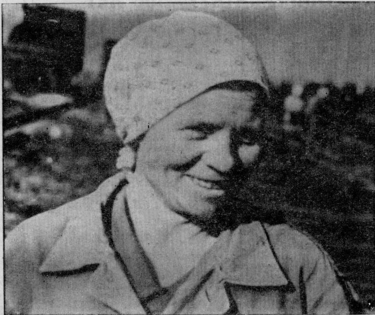
ЕЕ ИМЯ—НА ДОСКЕ ПОЧЕТА