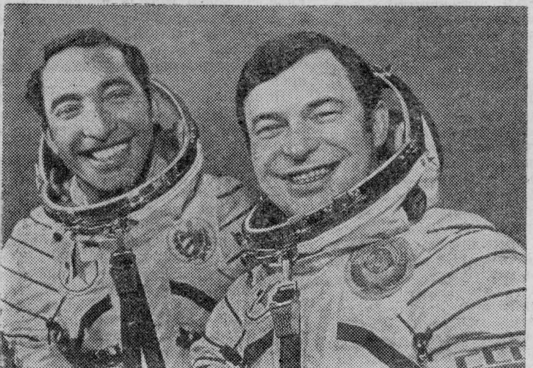
Международный экипаж космического корабля «Союз-38» — командир корабля, летчик-космонавт СССР, Герой Советского Союза, полковник Ю. В. Романенко (справа) и космонавт-исследователь, гражданин Республики Куба, подполковник Арнальдо Тамайя Мендес.