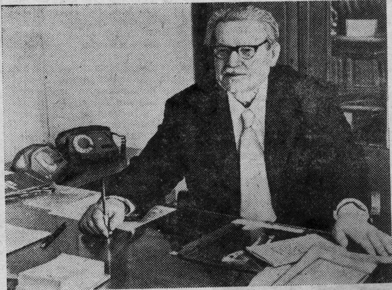
Москва. Герой Социалистического Труда директор Главного ботанического сада Академии наук СССР академик Н. В. Цицин (на снимке) за цикл работ по разработке теоретических основ отдаленной гибридизации и созданию новых ценных видов, форм и сортов сельскохозяйственных растений удостоен Ленинской премии 1978 года.