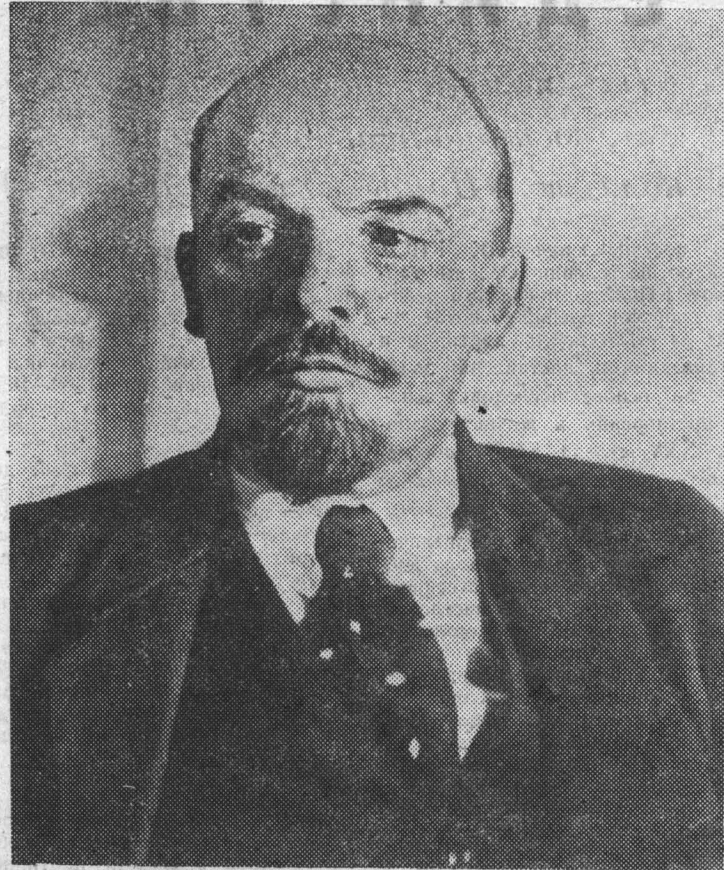
В. И. Ленин. Москва, 16 октября 1918 года.

К 108-й ГОДОВЩИНЕ СО ДНЯ РОЖДЕНИЯ В. И. ЛЕНИНА