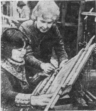
Школы мастеров народного творчества созданы во многих городах Польши. Молодежь постигает здесь основы ковроткачества, лепки, гончарного производства, резьбы.