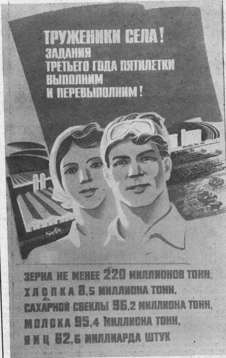
Плакат художника Г. Гаусмана. Издательство «Плакат».

сее имеет соблюдение технологической дисциплины. В любом хозяйстве прежде всего агроном должен четко разобраться в технологии возделывания культур, изучить слабые и сильные стороны системы. Самая простая система увязки технологических операций такая: сначала сделай одно дело — затем бери за другое. По такому правилу организуется закрытие влаги. На эту работу надо ставить весь гусеничный парк тракторов и не отвлекать их, пока не будет прибита влага на всей площади.