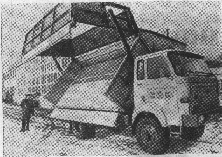
Польша. Страховицкий автозавод — большое современное объединение, выпускающее грузовые машины различных модификаций. Это и вездеход «Стар-660», и малотоннажные грузовики «Стар-28» и «Стар-29», и автоцистерна для загрузки самолетов сельскохозяйственной авиации химическими препаратами.