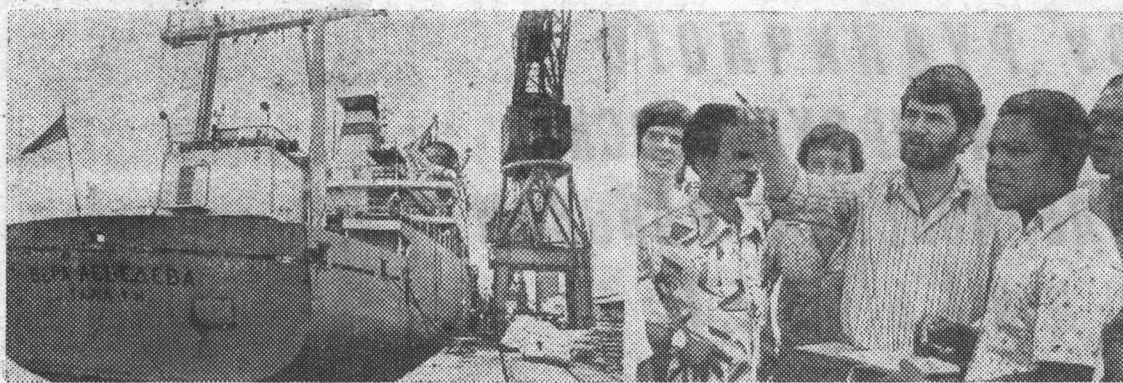
В 120 стран перевозят грузы советские суда. За год они совершают более 30 тысяч заходов в иностранные порты. Советские корабли с мирными грузами можно часто видеть и в порту Луанды, столицы Народной Республики Ангола.