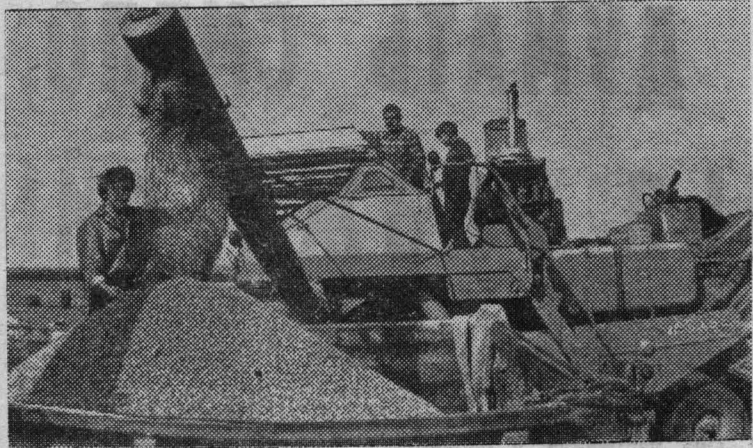
Орловская область. В сложных погодных условиях земледельцы колхоза «Луч революции» Урицкого района вырастили хороший урожай.

В ответ на решения июльского Пленума ЦК КПСС колхозники взяли высокие социалистические обязательства: собрать в среднем с гектара не менее 33 центнеров зерна, в закрома Родины засыпать 20 000 центнеров зерна — это два плановых задания.