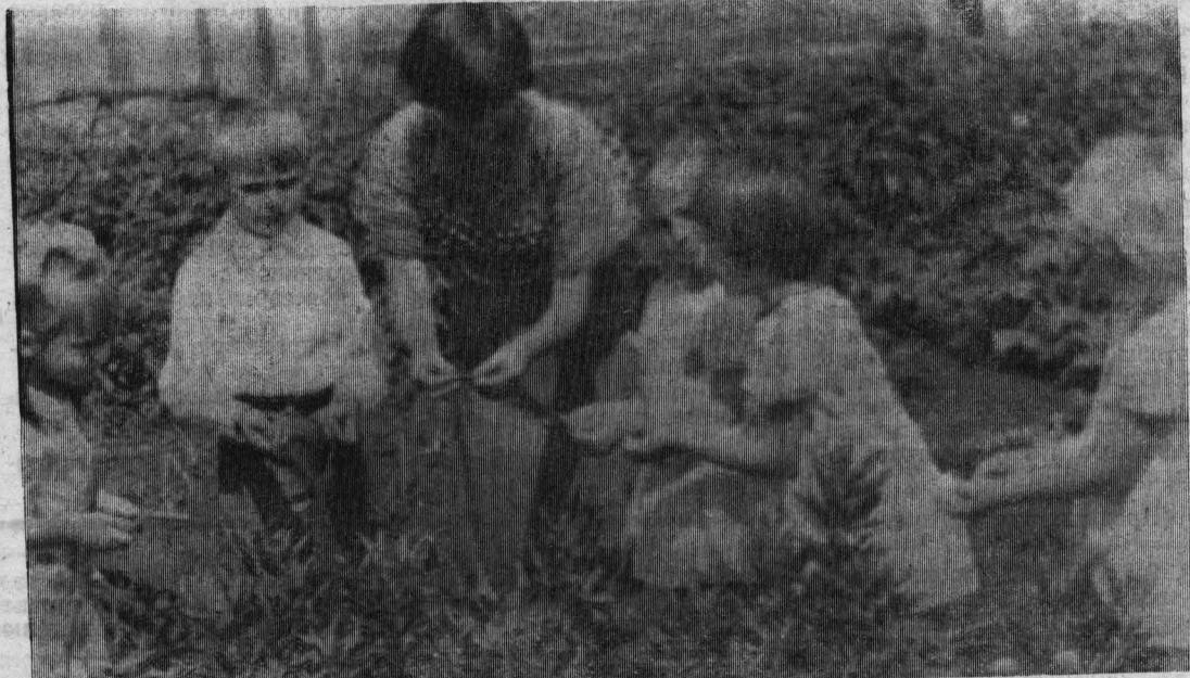
НА СНИМКЕ: малыши детсада «Солнышко» на овощном участке.

(Из приветствия ЦК КПСС, Президиума Верховного Совета СССР и Совета Министров СССР Всесоюзному съезду учителей).