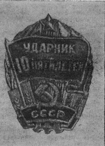
Знак «Ударник десятой пятилетки».