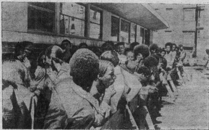
США. Очередь безработных у одной из бирж труда Нью-Йорка.

Каждое утро приходят сюда молодые горожане — белые и черные, с дипломами и без них — в надежде получить хотя бы временную работу. Но везет только единицам.