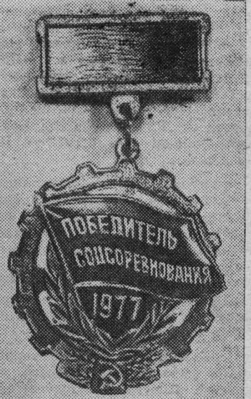
Знак «Победитель социалистического соревнования» 1977 года.