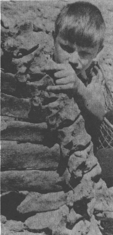
На снимках: вот это косточки! Часть рога бизона.